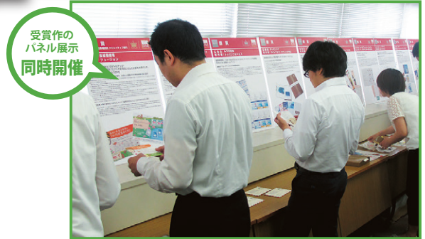
受賞作の パネル展示 同時開催

全日本DM大賞受賞作品のうち上位事例について、各担当者様から制作のプロセスや課題解決方法などをご講演いただき、DMの持つ効果・販促計画における使い方を学びます。また、会場内に講演企業他数点の第30回全日本DM大賞受賞DM(実物)とパネル展示を行いますので、様々な事例を手にとりご覧いただけます。