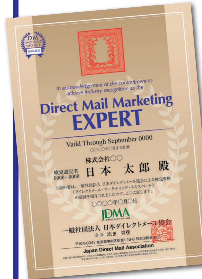
DMマーケティングエキスパート認定証